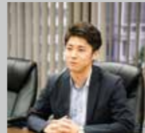
安田洋祐 (経済学者)