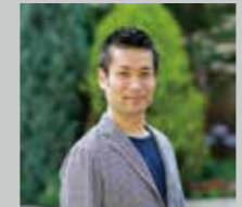
山崎亮 (コミュニティデザイナー)