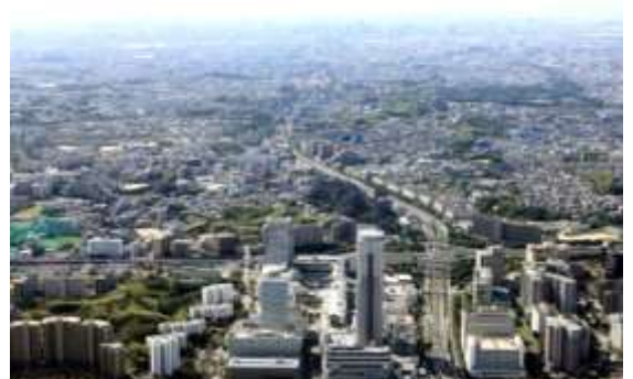
建築物や緑等が調和したまちなみ（千里中央地区から南方向を望む）