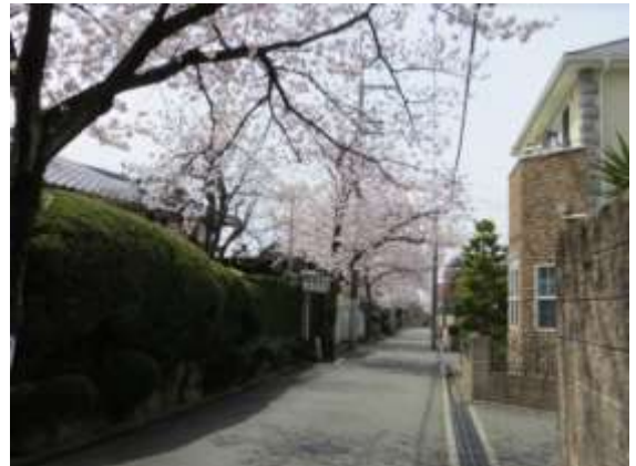
桜並木と調和したまちなみ（永楽荘）