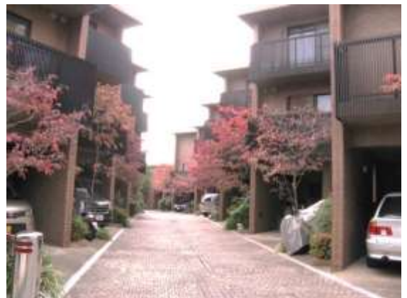
デザインのまとまりが心地よいまちなみ（中桜塚）