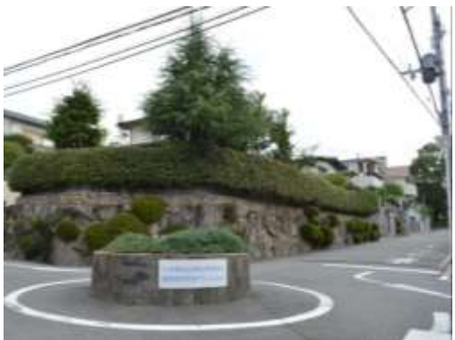
待兼山町南地区建築協定