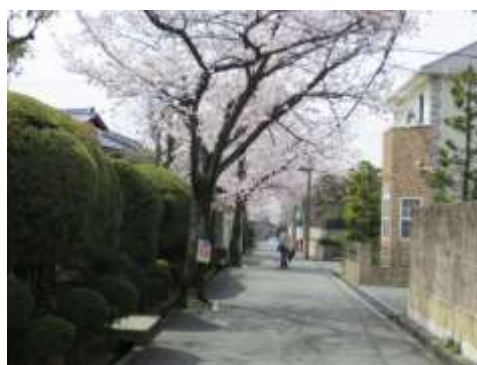
良好な住環境保全に向けて景観形成協定が締結されている永楽荘桜自治会地区

そのため、市はそれぞれの地区にふさわしいルールづくりが進められるように、必要な助言や支援を行う等の協働の取り組みを進めます。