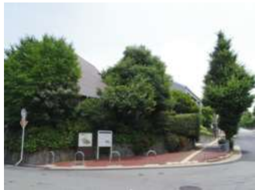
新千里南町3丁目住宅自治会地区景観形成協定