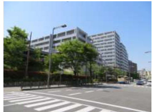
団地の建て替えにあわせて地区計画を策定した新千里西町B団地地区地区計画