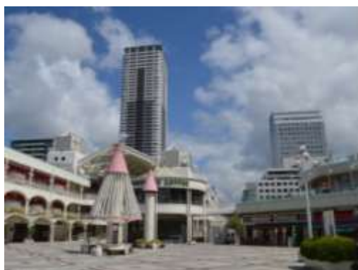
千里中央地区地区計画