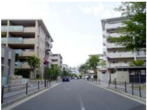
東豊中第一団地地区地区計画