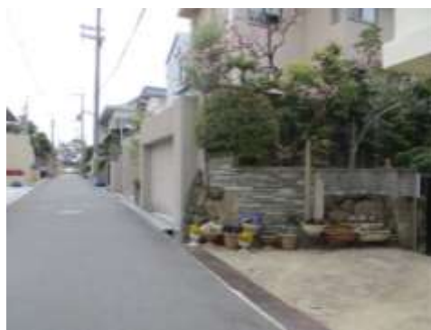
住民発意の地区計画策定が進む緑丘地区