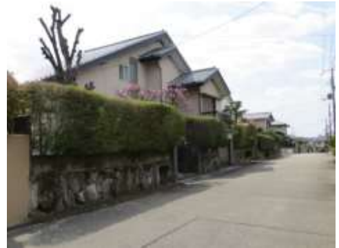
自治会の申し合わせから景観形成協定へと発展させた新千里南町3丁目住宅自治会地区