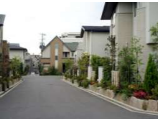
東豊中町6-1地区緑地協定