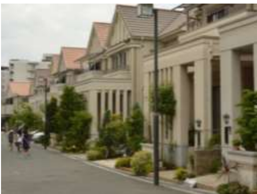
ドリームハウス旭丘建築協定