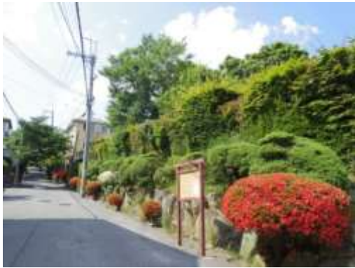
永楽荘桜自治会地区景観形成協定