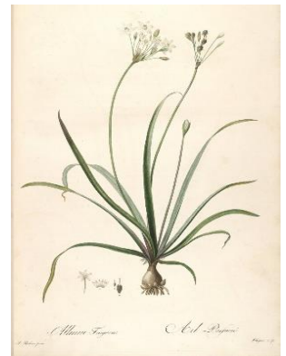
ルドゥーテが描いた ハタケニラ

さらに、果実が熟すと黒いタネを撒き散らし、それも発芽します。球根とタネの両方で増えるため、完全に取り除くのはなかなか難しいのです。