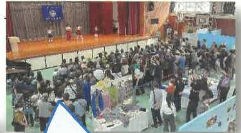
ステージパフォーマンスは、盛大に開催