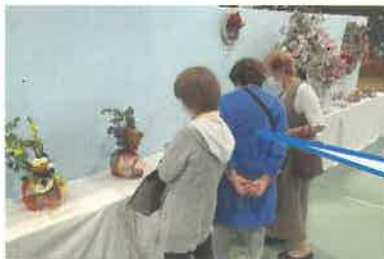
絵画、書道、写真等の展示