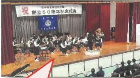
第 16 中学吹奏楽部による オープニング演奏