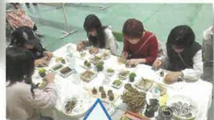
多肉植物の寄植え体験