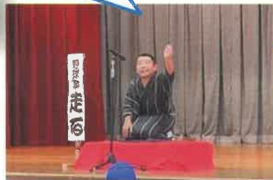
非常に面白く、上手な落語を披露