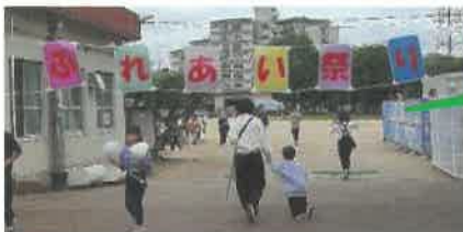
ようこそ、ふれあい祭りへ

10月26日(日)北条小学校運動場でふれあい祭りを開催しました。雨の予報でしたが、当日は曇り空の開催となりました。文化祭との同時開催ということもあり、模擬店出店数は8店でしたが、予想以上に盛り上がり、売り上げ好調な出店者もありました。天候の心配もあったため、射的ゲーム等の飲食物を取り扱わない模擬店は、学校校舎の軒下を利用し、開催しました。