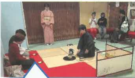
結構なお点前でした

舞台でのパフォーマンスも「もっと長く見たかった」との声があり、興味を持って鑑賞いただけて、社会教育の場を提供する公民分館の活動が、うまく機能したのではないかと感じました。関係諸団体また、皆さまのご理解とご協力により、文化祭が開催できたことを感謝いたします。ありがとうございました。