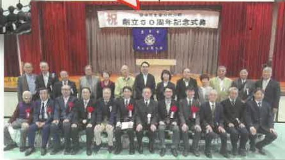
公民分館代表をはじめとする 公民分館功労者、来賓関係者 との集合写真