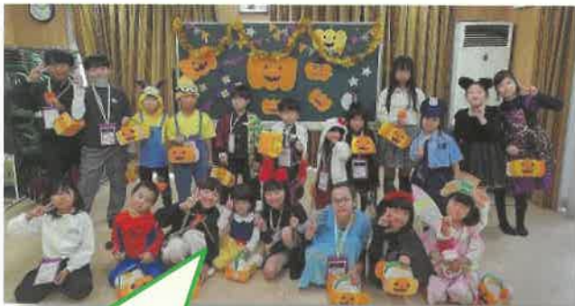
かぼちゃのバスケットを作り、 いろんな仮装で集合写真!

・「きんもくせい」の香り漂う 11 月 2 日に開催しました。今回は、20 家族 24 名の子ども達が賑やかにカボチャのバスケットを作り若北会館をスタート!! スタンプラリーの会場は、幸楽の里、北条東自治会館、北条西自治会館、北条小学校体育館前の 4 ヶ所です。仮装をした子ども達は、「お菓子をください」と元気よく歩いて、ゴールの若北会館でキャンディをつかみ取りして、コンプリート!!