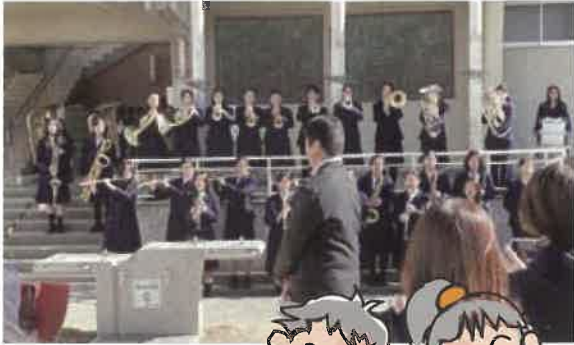
4中吹奏楽団オープニング

晴天のもと中豊島小学校でなかてフェス2025を開催。四中吹奏楽団をはじめとして地域の大勢の方たちが出店、出展、出演しフェスを盛り上げました。大勢の来場者でビンゴ大会も盛り上がり地域のつながりを感じる1日となりました。