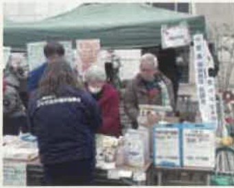
ハットリエナーレ 社協デント