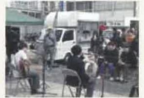
ハットリエナーレ コンサート