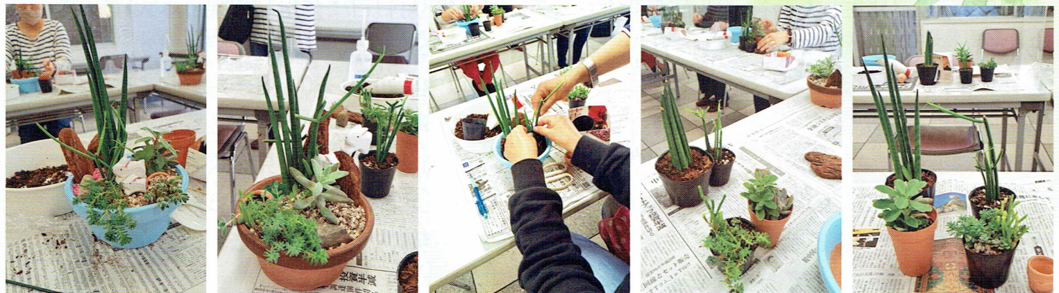
多肉植物の寄せ植え