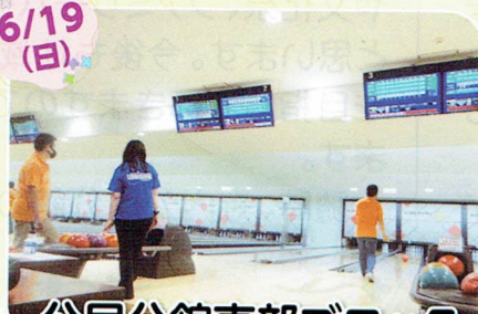
公民分館東部ブロック ボウリング大会(優勝)