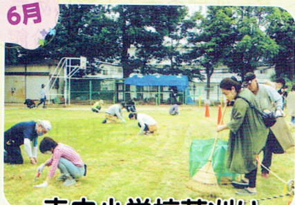
寺内小学校芝刈り