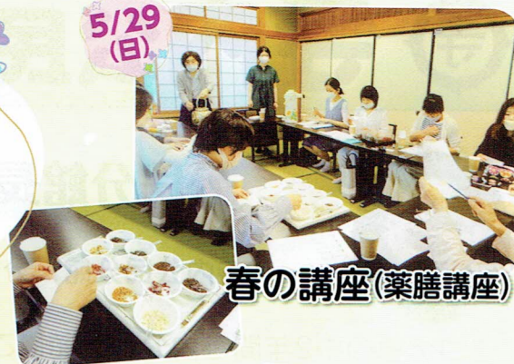
春の講座(薬膳講座)