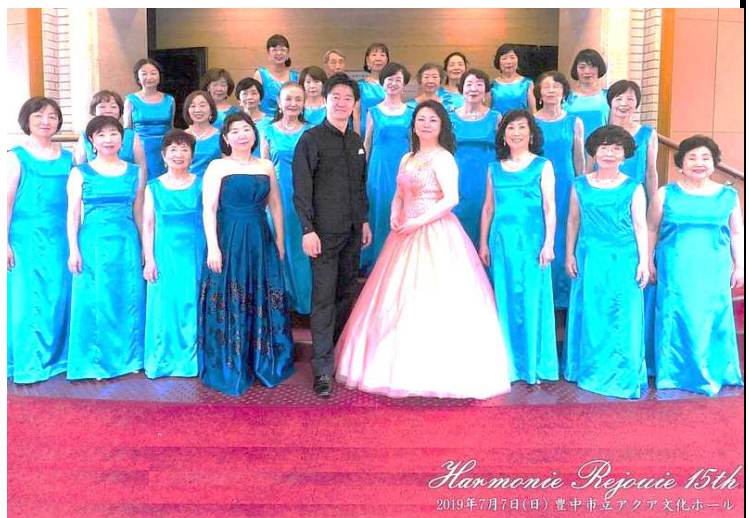
Harmonie Rejouie 15th 2019年7月7日(日) 豊中市立アーク文化ホール