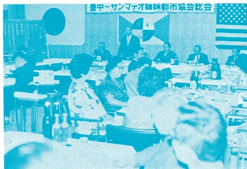
総会で挨拶する市村会長