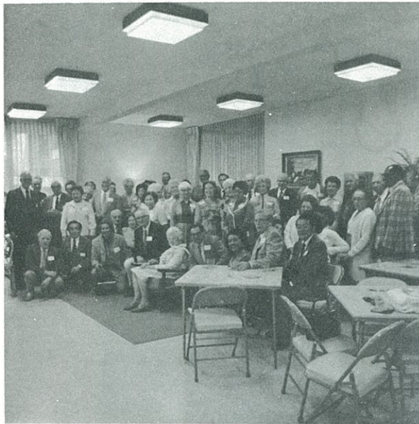
金婚式に走せ参じた友人、知人達と