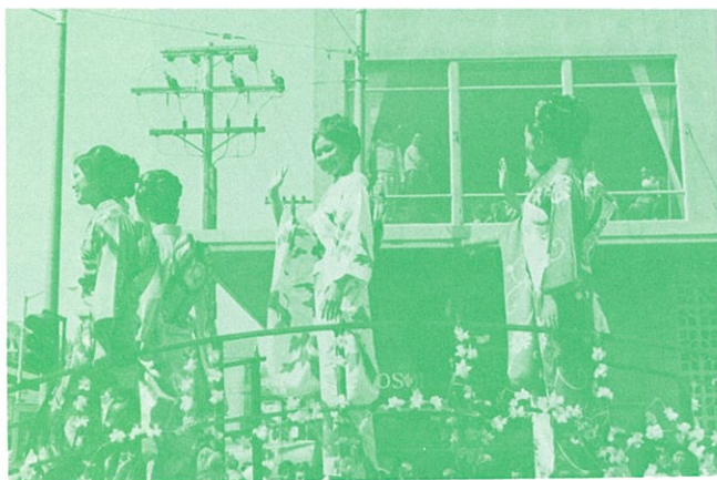
サンフランシスコ市内をパレードするマジョリエ嬢

これは、毎年サンフランシスコ市が春に行なっている桜祭でミス桜を選ぶもので、1974年度は、我が姉妹都市サンマテオ市民の日系三世の彼女が選出されたものです。そして選ばれた女王は、サンフランシスコ市の姉妹都市である大阪市を親善訪問するのが恒例で、彼女も先ず大阪市を訪ね其の後、サンマテオ市長よりのメッセージを携さえて豊中市を公式訪問しました。