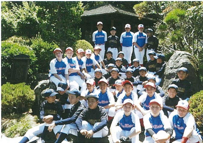
サンマテオ市日本庭園にて

海外経験は初めてという選手たちも多数いる中で、言葉や生活習慣の違いに適應できるかと、不安もあったかもしれませんが、野球の試合になると不安も緊張も忘れて一人ひとりが全力を出し切ったようです。豊中チーム対サンマテオチームの親善試合の結果は3勝1敗。最終の一戦は、両チームの選手もコーチもミックスしてのゲームを楽しみ、より一層両国の距離が近づいた時間となったことでしょう。