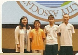
ホストファミリーとの出逢い