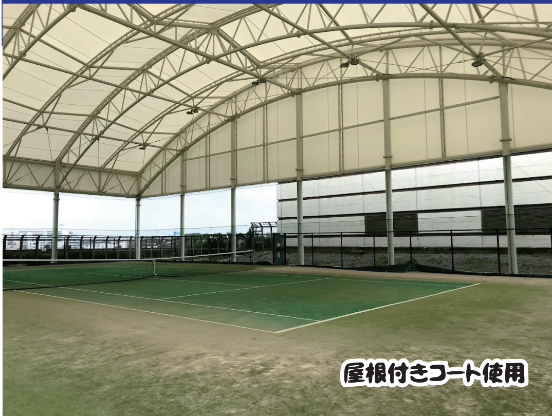
屋根付きコート使用