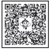
指定排水設備 工事業者一覧