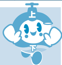
豊中市上下水道局 キャラクター「アックッピー」