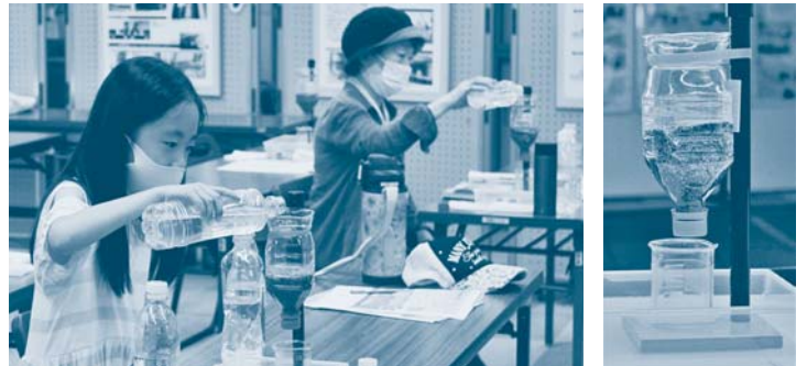
一人ひとりで実験作業できます

なお、同じ内容で市民団体を対象にした出前講座も実施しています。関心を持たれた方はお気軽に局にお問い合わせください。