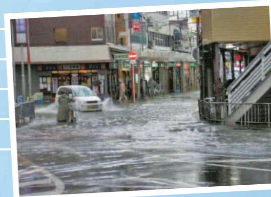
◀阪急豊中駅前の道路。平成18年(2006年)の豪雨で浸水しました

近年、想定を超える豪雨により、全国各地で浸水被害が発生しています。豊中市では平成11年(1999年)から、「10年に1度の大雨」(1時間当たり50mm程度の大雨を想定)が降っても水害が発生しないよう、浸水対策事業に取り組んでいます。今回は、その中から、現在、阪急豊中駅周辺で行っている雨水パイプ工事について紹介します。