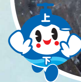
豊中市上下水道局 キャラクター「アクッピー」

近年、想定を超える豪雨により、全国各地で浸水被害が発生しています。豊中市では平成11年(1999年)から、「10年に1度の大雨」(1時間当たり50mm程度の大雨を想定)が降っても水害が発生しないよう、浸水対策事業に取り組んでいます。今回は、その中から、現在、阪急豊中駅周辺で行っている雨水パイプ工事について紹介します。