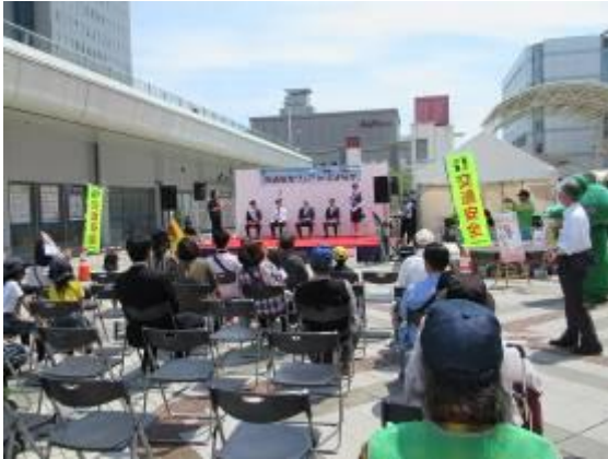
春の交通安全フェア in とよなか