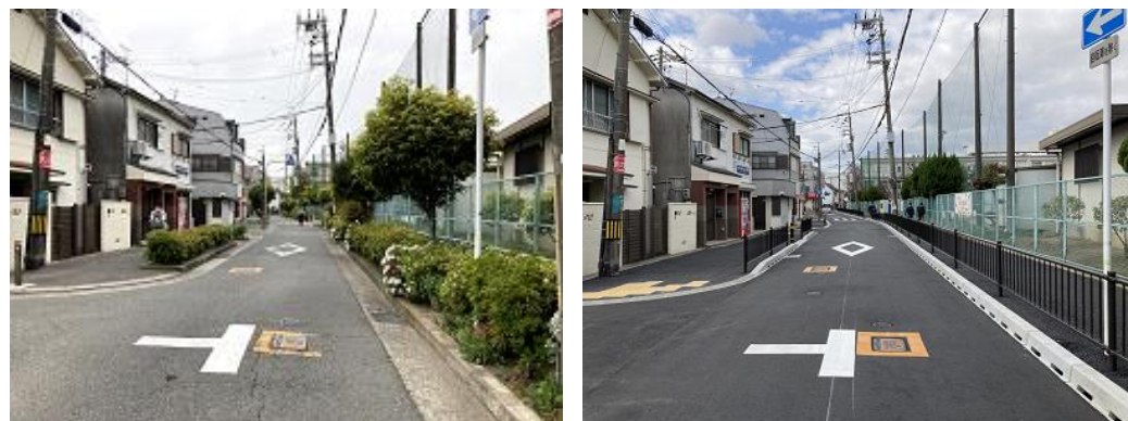
令和5年度施工 庄内南1号線(改良前後)