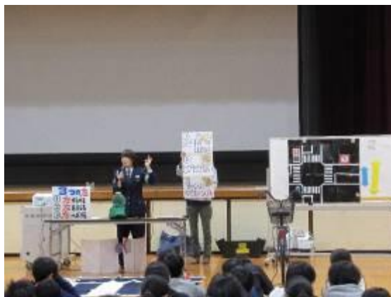
小学校での交通安全教室