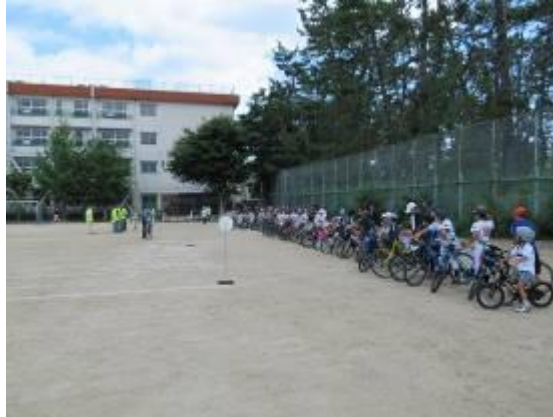
地域主催の交通安全教室