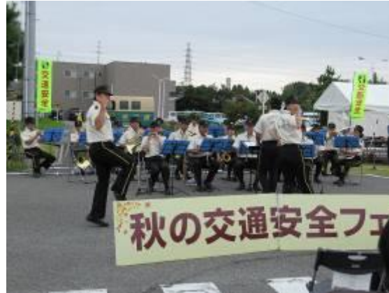
秋の交通安全フェア