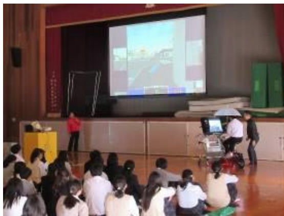
中学校での交通安全教室