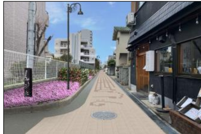
庄内西町市有7号の完成CG