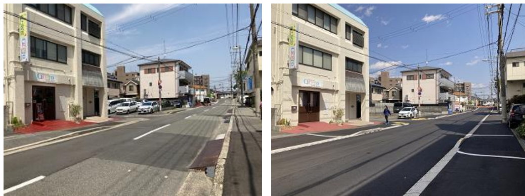
令和5年度施工 平塚熊野田線(改良前後)

「歩道改良実施計画(令和3年度改訂版)」に基づき、拡幅や構造形式の変更などの道路改良に取り組みます。