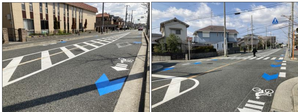
令和4年度（2022年度）整備箇所

「豊中市自転車ネットワーク計画」（令和5年度改訂版）に基づく短期計画整備路線と緊急に整備を要する路線。