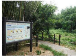
春日町ヒメボタル特別緑地保全地区