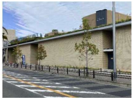
文化芸術センター