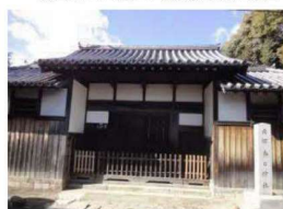
史跡春日大社南郷目代今西氏屋敷