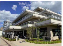
庄内コラボセンター「ショコラ」