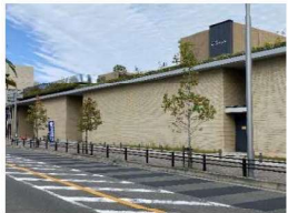
文化芸術センター