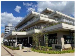
庄内コラボセンター「ショコラ」