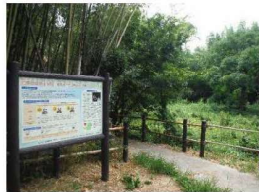
春日町ヒメボタル特別緑地保全地区