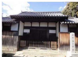
史跡春日大社南郷目代今西氏屋敷