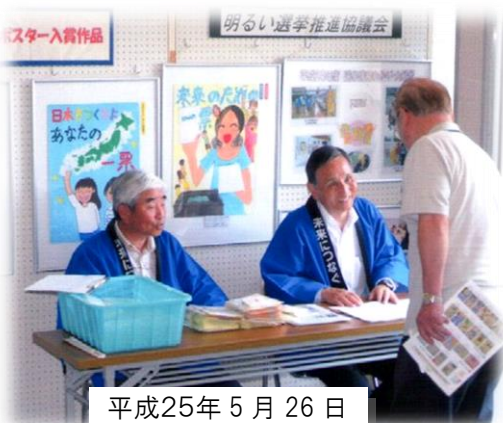
平成25年5月26日 上新田会館

同会は公正な選挙を推進するために昭和38年に設立された市民団体で、「きれいな選挙の実現」や「投票率の向上」を目的に豊中市内の公民分館等が主催する文化祭や成人式会場等へ出向き、「選挙啓発キャンペーン」として明るい選挙啓発ポスターコンクール入賞作品の展示や有権者や新成人へ啓発物品を配布するなどの啓発活動の他、選挙啓発広報誌「白ばらとよなか」発行など多くの活動をおこなっています。