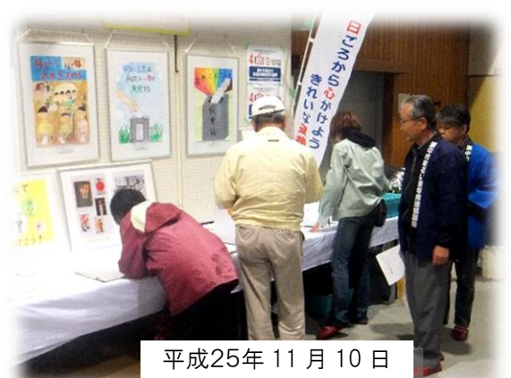
平成25年11月10日 桜井谷東小学校体育館