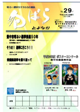
白ばらとよなか29号 (平成25年3月発行)