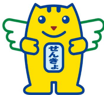
明るい選挙のイメージキャラクター 選挙のめいすいくん

編集・発行 豊中市選挙管理委員会 〒561-8501 大阪府豊中市中桜塚3丁目1番1号 TEL 06-6858-2480 FAX 06-6854-0496