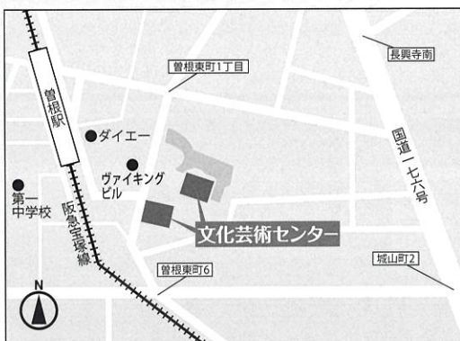
豊中市立文化芸術センター MAP

オフィシャル・ホームページ https://www.century-orchestra.jp/