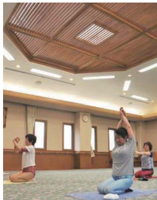
会館で健康体操を行う地域の人たち

平成14年(2002)に建てられたこの建物は上新田会館に続く2つ目の地区会館。当時の自治会長の「この地域にある竹林を後世に伝えよう」との思いから名付けられました。1階から2階は吹き抜けになっている特徴的なデザインです。