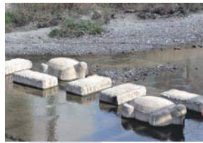
上流には大きなカメの飛び石も

箕輪橋から興正橋の間にある親水公園はウォーキングや愛犬との散歩を楽しむ人たちの休憩スポット。毎年7月に開催される「アクアユートピア運動」では子どもから大人まで協力して清掃活動を行っています。昨年集めたごみは、およそ850キログラム。地域の皆さんによって大切に守られている公園です。