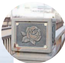
左側が豊吹橋、右側が豊吹小橋

豊中市と吹田市の市境を流れる高川に架かる2つの橋。豊吹橋は車両、豊吹小橋は歩行者と自転車を通ります。豊中市側から渡ると豊中市の花・バラが、吹田市側からは吹田市の花・サツキが見送ってくれる小粋な橋です。