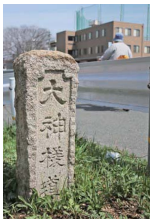
旧三国街道沿いに残る渡し場を示す道標