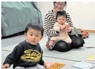
おはなし会では親子が集まり絵本と触れ合います