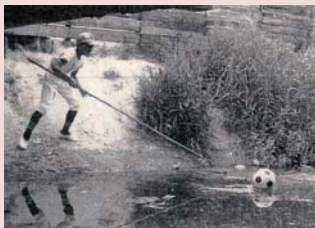
用水路に落ちたボールを拾うのも一苦労でした

高川小学校開校当時、運動場の中央に用水路があり、橋を2つ渡らないと校舎から運動場へ行けませんでした。保護者や地域の人たちの願いがかない、昭和49年(1974)に用水路は埋め立てられました。