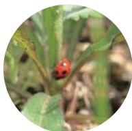
道標の近くでテントウムシを見つけました

江戸時代から明治末期まで、豊中市内で収穫された農産物を大阪市内に運ぶのに活躍した神崎川の渡し場。箕面の勝尾寺参詣の人などにも利用され、当時の往来を伝える道標が残っています。