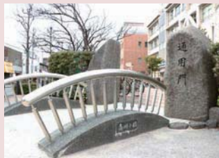
通門の前に小さな橋が架けられ、当時の面影を伝えています