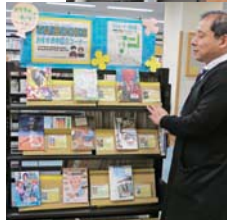
中学・高校生向けの本をイベントに合わせて展示する棚もあります