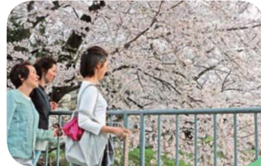
春にはサクラが咲き誇ります

天竺川沿いの並木道は、夏は万緑、秋には紅葉と、四季折々の姿を楽しむことができ散策にお勧めです。