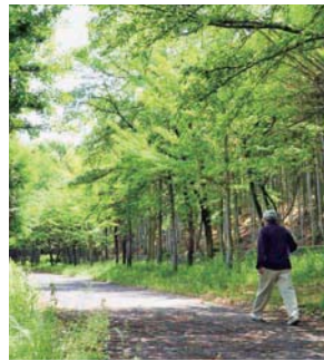
間伐作業によって竹林は明るく保たれています

竹林とサクラなどの木々が並ぶ遊歩道。東泉丘小学校(東泉丘3丁目)の子どもたちが安心して歩けるよう、地域の人たちが協力して竹林の間伐や清掃活動を行っています。