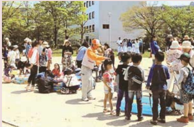
地域の皆さんによる出店やフリーマーケットが行われ、たくさんの人でにぎわいました

新千里南町3丁目のつばき公園。ニュータウンに住む人たち同士の交流の場にしたいと5年前から自治会が開催する、「春まつり」の会場としても有名です。