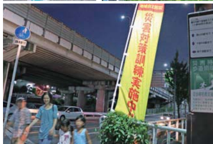
実際に歩く帰宅訓練も行われています