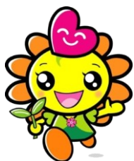
「アカリイーネ」ちゃん