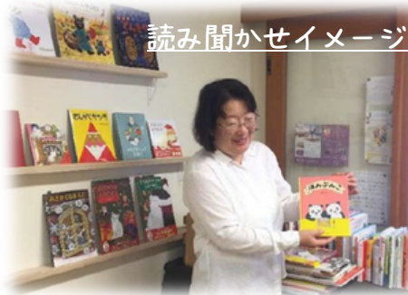
読み聞かせイメージ