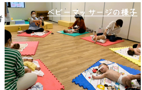
ベビーマッサージの様子

子どもとのアタッチメントの形成にスキンシップも良いといわれています。赤ちゃんの肌に触れ赤ちゃんもみなさんも嬉しい、ほっこりとした時間を過ごしませんか?さあたくさん触れ合って癒し合いましょ♡