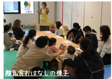
離乳食おはなしの様子

離乳食を始めてみて不安に思う事や疑問に思う事など、栄養士の先生とお話しませんか?。みんなはどんなもの食べてる?こんなときどうする?など、情報を交換したりみんなの様子もきいてみよう♪