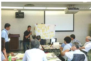
代表者が発表しました