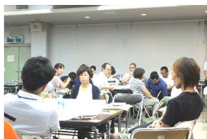
ワークショップの説明を聞いています