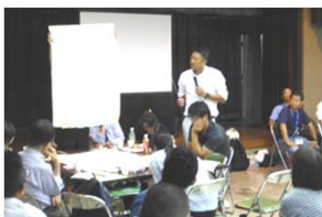
発表に耳を傾ける皆さん