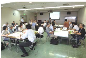
ワークショップの説明を聞いています