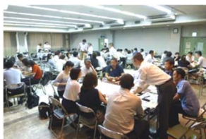
意見を出し合っています