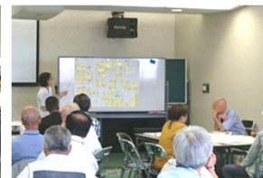
発表に耳を傾ける皆さん