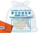
缶と小型家電が 同じ袋に 入っている