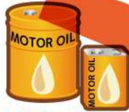
自動車・バイクの オイル缶 (18ページ参照)