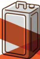
大きさが 25cm×25cm×15cm 以上の缶 (一斗缶など) (4ページ参照)