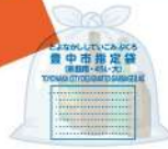
缶とビンが 同じ袋に 入っている