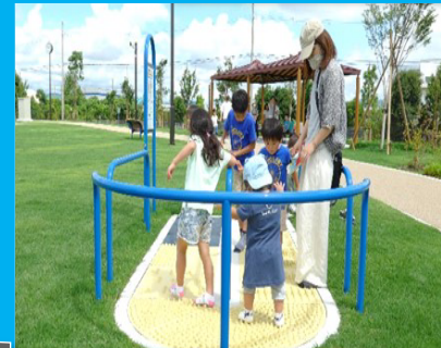
⑦足つぼマッサージ