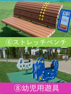
⑥ストレッチベンチ