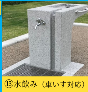
⑬水飲み（車いす対応）