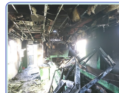
プラスチックリサイクル工場（他施設）の建屋・設備が焼けてしまった事例