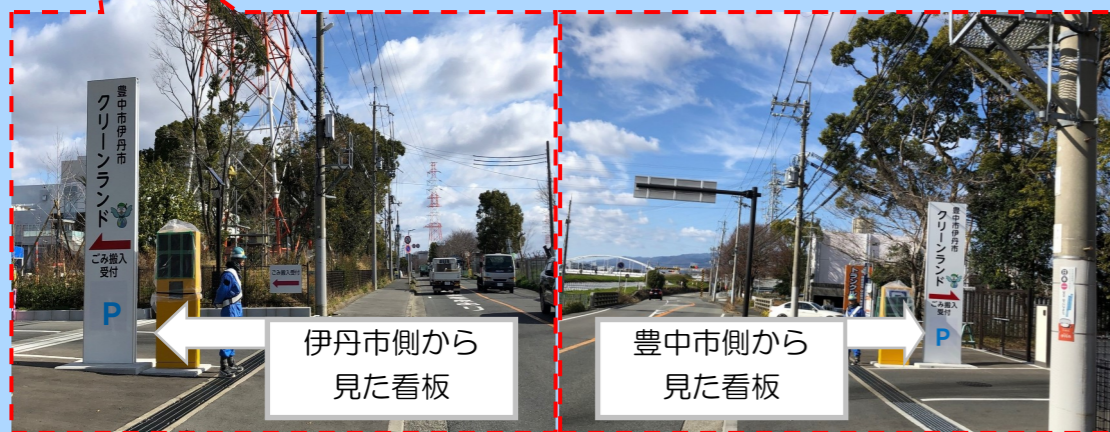
伊丹市側から見た看板