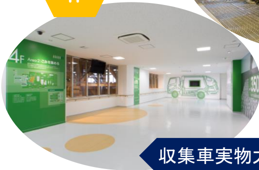
収集車実物大パネル