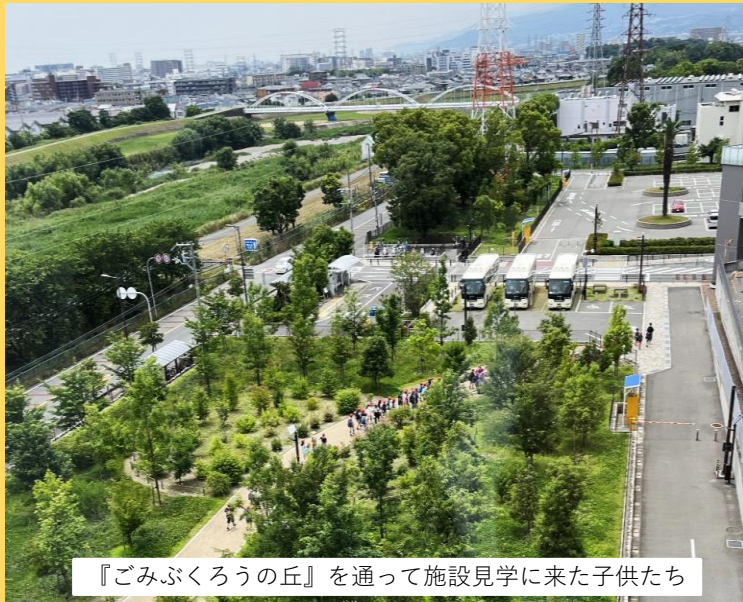
『ごみぶくろうの丘』を通過して施設見学に来た子供たち