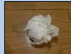
ティッシュペーパー