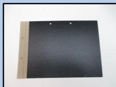
台紙(圧縮段ボール) (金属は取る)