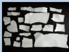
やぶったメモ用紙