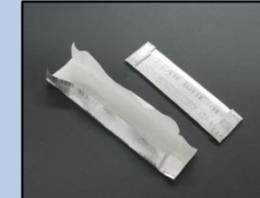
ガムなどが包まれていた 銀紙