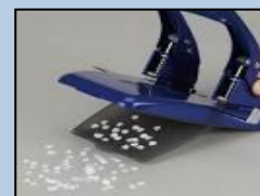
穴あけパンチのくず