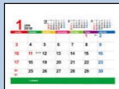
カレンダー (金属やプラは取る)