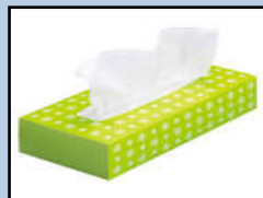
ティッシュペーパーの箱 (ビニールは取る)