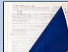
カーボン紙が 貼られているもの