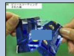
コーティングしている紙