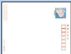
ハガキ (インクジェット用紙〇)