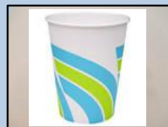
紙コップ (防水加工された紙)