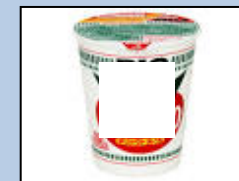
カップ麺のふた及びカップ(紙)