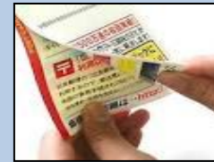
圧着ハガキ (剥がすもの)