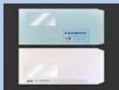
窓開き封筒(フィルムは取る。紙のフィルムは取らなくてよい)