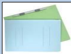
フラットファイル (金属やプラは取る)