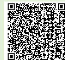
とよなかエコショップガイドブック vol.2

環境に配慮した取組みを実施している「豊中エコショップ認定店(170店舗※令和4年1月末現在)」を市民の方などに積極的に利用していただくことで、環境保全につながることを目的に制作しました。エリア別マップ付きで、量販店・飲食店・小売店3つの業種に分けて、各店舗情報や取組みを紹介しています。