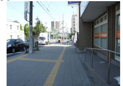
国道 176 号