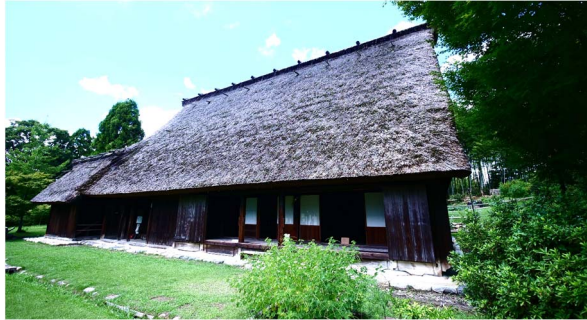
飛騨白川の合掌造り民家 20人で住んでいたとか！？