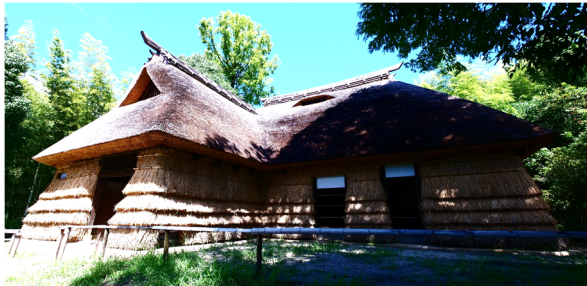
信濃秋山の民家 壁も茅葺きで、独特な雰囲気があります。