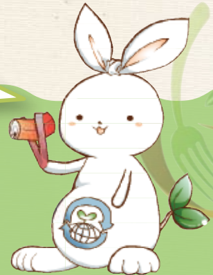
豊中市ごみ減量PRキャラクター「リサビット」

食生活における「もったいない」の“気づき”によりごみを減らそうという思いを込めて、この冊子を作成しました。