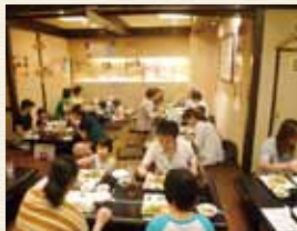
おやこ・子ども食堂

現在、毎月第4日曜日に、NPO法人庄内わんぱくの社と豊中市の後援で実施しています。「おやこ・子ども食堂」と名前に入っていますが、地域の人が集まり、笑顔がいっぱいある場所にできたらとの思いで運営していますので、シニアの方も是非ご参加ください。私達の子ども食堂では、これまでに、お寿司づくり等の料理教室を開いたり、店で働くアルバイトの大学生が、子ども達に勉強で分からないところを教える取組みも併せて進めてきました。これからたくさんの方に参加していただき、交流を深めてもらいたいと思います。