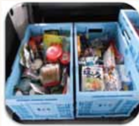
《提供された食品等》