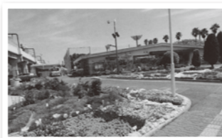
花壇の花苗の植替えや育成管理 および周辺の清掃 豊島公園 花とみどりの相談所 周辺花壇など