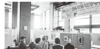
スケッチ展の様子