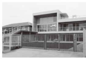
あつぷるこども園 蛍池中町3丁目