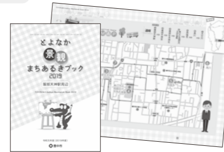
高校生が描いた作品を掲載 『とよなか景観まちあるきブック 2019』