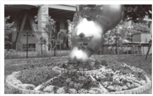
市民団体による草花等の育苗や 花壇活動 服部西町5丁目 ふれあい緑地