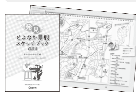
中学生が描いた作品を掲載 「発見！とよなか景観スケッチブック 2019」