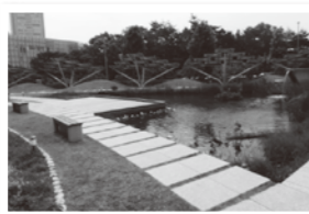
周辺地域の水辺と緑のネットワーク形成 新千里西町1丁目 パナホーム 「つながりの広場」