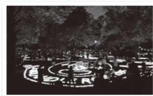
千里キャンドルロード 千里中央公園ほか