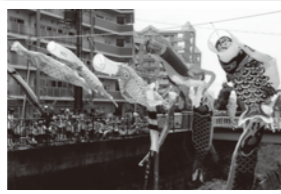
天竺川の清掃と「天竺川鯉のほり 風舞いフェア」の実行 天竺川八坂橋下手河川上空