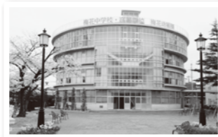
梅花中学校・梅花高等学校 円形校舎 上野西1丁目