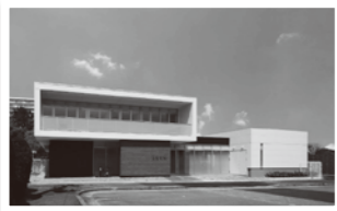
前田内科 新千里東町3丁目