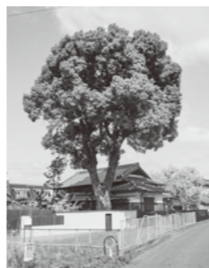
★樹木は私有地内にあるため、 敷地外からご覧ください。

現在もその高く立派な樹冠は地域のランドマークとして親しまれていることから、令和 2 年 9 月 10 日に都市景観形成建築物等指定第 3 号（樹木）として指定しました。