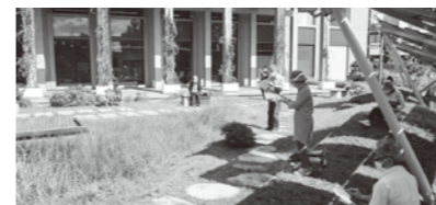
スケッチ講座の様子