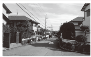
地区計画・都市景観形成推進地区 新千里南町2丁目