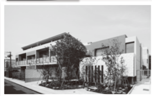
村田マンションアーティストコート 豊南町西2丁目