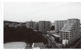
東豊中クラスヒルズ 東豊中町6丁目