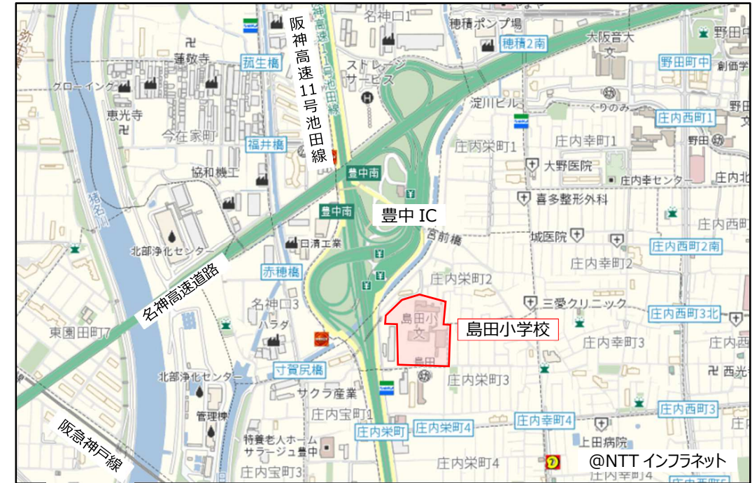
対象敷地範囲と路線価 ※国税庁 路線価図（令和 3 年分） 115,000～135,000 円