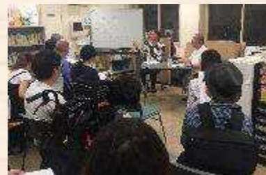
過去のちゃぶだい集会のようす