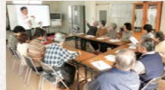
家庭内事故を防ぐための整理収納講座(ユニバーサルデザイン推進協会)

市民活動団体がみなさんのご近所まで出かけて、希望のテーマについて講習や体験講座を実施します。子育てや健康、音楽や生活などさまざまなメニューから興味のある講座を選んで申し込むことができます(利用にあたっては費用などの要件があります)。市民活動おでかけ講座の一覧や申込要件は、市のホームページやサロンでご覧になれます。