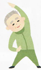
旭丘連合自治会 / 豊中ローズ元気UP体操