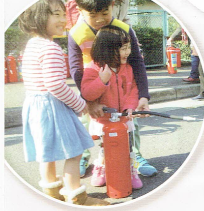
小曽根第4町会 / 防災訓練