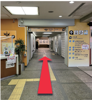
入り口から直進、一番奥のスペースです

豊中市役所内に新たにオープンした魅力発信コーナー（TIP）で、とよなか夢基金の紹介パネル等の展示を行います。