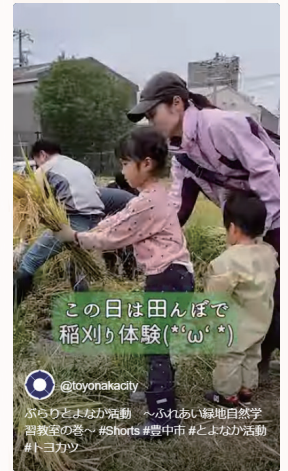
↑ふれあい緑地自然学習教室 稲刈り体験の様子