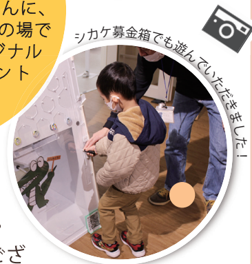
シカケ募金箱でも遊んでいたました！

コロナ禍が明け、市内の公益活動も活発になってきました。今年度は14のとよなか夢基金助成事業が決定し、地域の課題解決に向けた取り組みが進んでいます。コミュニティ政策課も、さんあいイベント（服部ふれあい緑地）・コラボまつり（千里文化センター）・ショコラフェスタ（庄内コラボセンター）に夢基金PRブースを出展させていただきました。お立ち寄りくださったみなさま、募金にご協力くださったみなさま、ありがとうございました。募金という形で寄付をしていただき、市民活動を知る・応援するきっかけになっていただけていたら幸いです。今後も市内のさまざまなイベントに出展します。夢基金マークや赤いジャンバーの「協Do」スタッフを見かけましたらぜひお声がけください。