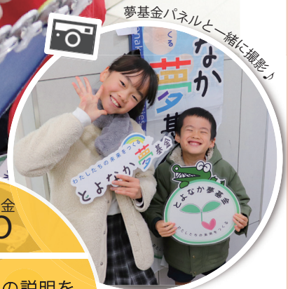
夢基金パネルと一緒に撮影♪