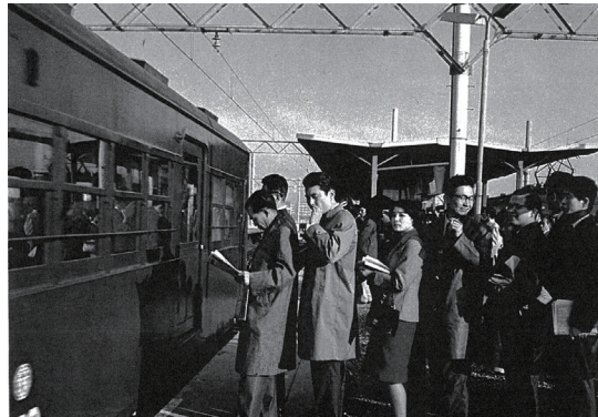
写真-25 昭和40年代の通勤風景

千里ニュータウンの開発地は、大阪市の中心部から近距離にあつて、都心からの鉄道、地下鉄の延伸も考えられていたため、イギリスのニュータウンのような職住近接の都市ではなく、都心の職場に通勤することを前提とした「住宅都市」として計画されました。