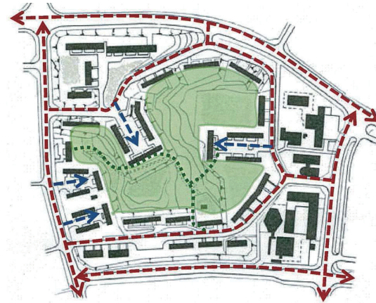
府営住宅に導入されたラドバーン方式の例

中庭を囲む形に住棟を配置する「囲み型配置」としてラドバーン方式を取り入れました。車はクルドサック(袋小路)でUターンさせて、中庭には車が入らない居住者共用の庭としました。その後マイカーが普及するようになると中庭に駐車場が設けられ、残念ながら歩車分離の形は崩れます。