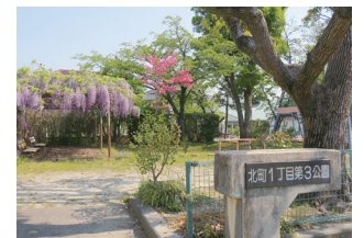
北町1丁目第3公園(新千里北町) *幼児遊園