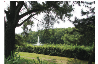
榎ノ木公園(新千里北町) *近隣公園→地区公園