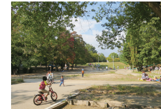
千里中央公園(新千里東町) *地区公園→総合公園