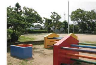
つつじ公園(新千里北町) *児童公園→街区公園