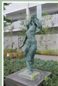
「HEAVEN'S WOMAN」 堀田 大貴 作