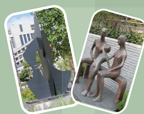
「BIG COMPOSITION」 アレクサンドラポルフィディア 作