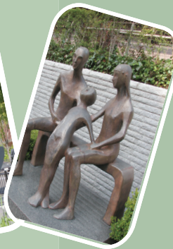
「語らい」 本多 厚二 作