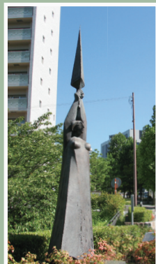
「にわか雨」 工藤 健 作