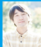
指出一正氏 (ソトコト)