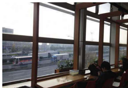
建物中高層部からの眺め