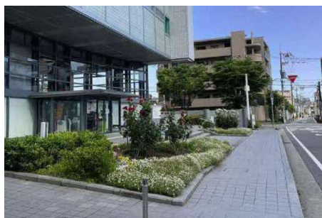
公共施設の敷際 豊中まちなみ市民賞受賞作品