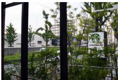
建物低層部からの眺め