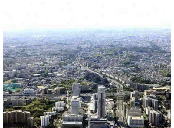
建築物や緑等が調和したまちなみ（千里中央地区から南方向を望む）