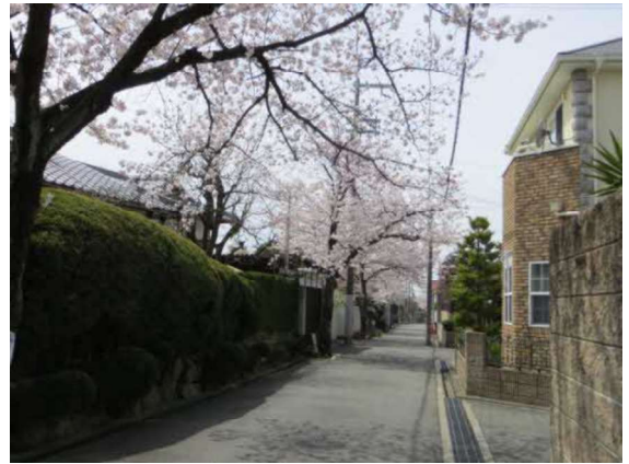
桜並木と調和したまちなみ（永楽荘）