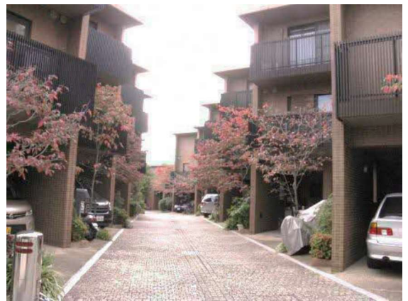
デザインのまとまりが心地よいまちなみ（中桜塚）