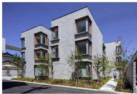
住宅地の敷際 豊中市都市デザイン賞受賞作品