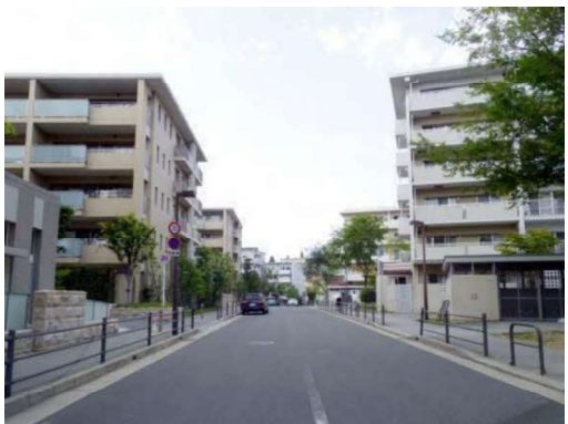
東豊中第一団地地区地区計画