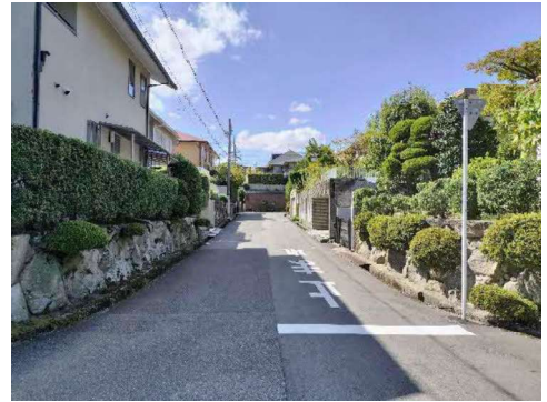
自治会の申し合わせから都市景観形成推進地区へと発展させた新千里北町2丁目地区