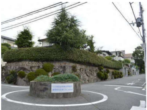
待兼山町南地区建築協定