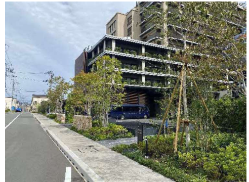
地区の再整備にあわせて都市景観形成推進地区を指定した北緑丘1丁目地区