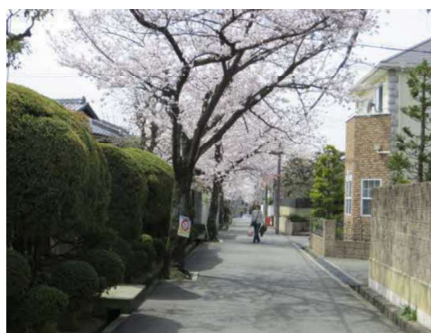
良好な住環境保全に向けて都市景観形成推進地区の指定、地区計画を決定した永楽荘地区

そのため、市はそれぞれの地区にふさわしいルールづくりが進められるように、必要な助言や支援を行う等の協働の取り組みを進めます。