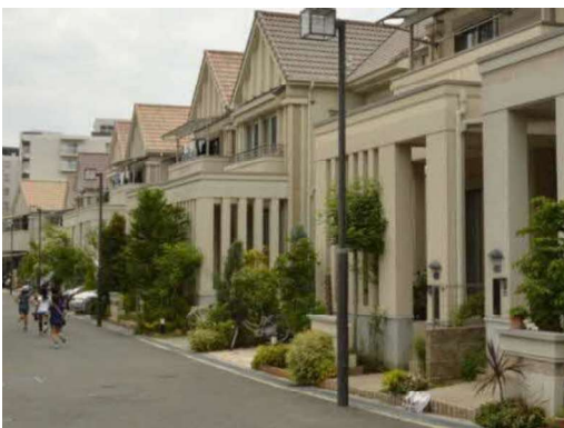
ドリームハウス旭丘建築協定