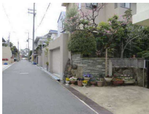
住民発意のもと、地区計画の決定がされた緑丘地区