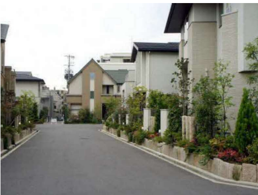
東豊中町6-1地区緑地協定