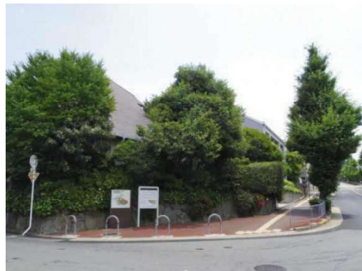
新千里南町3丁目住宅自治会地区景観形成協定