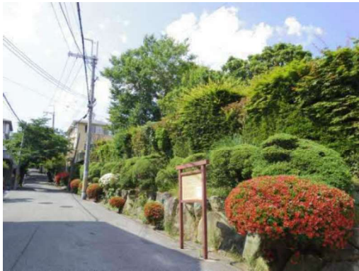
永楽荘地区都市景観形成推進地区 永楽荘地区地区計画