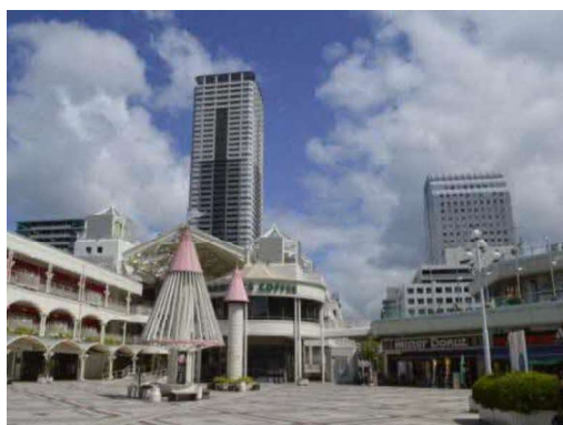
千里中央地区地区計画