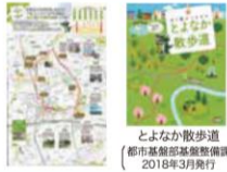
とよなか散歩道 (都市基盤部基盤整備課 2018年3月発行)

「とよなか百景」のうち、冊子「水と緑がちなとよなか散歩道」沿いの二十景を巡り、スマートフォンでスタンプを集めるモバイルスタンプラリーです。豊中の多彩な魅力を感じてください。