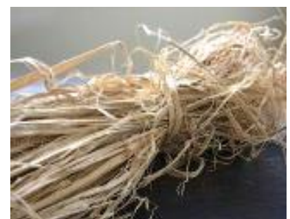
紙の原料となる樹皮