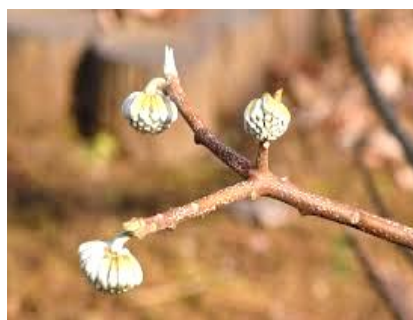
ハチの巣のようなミツマタの蕾